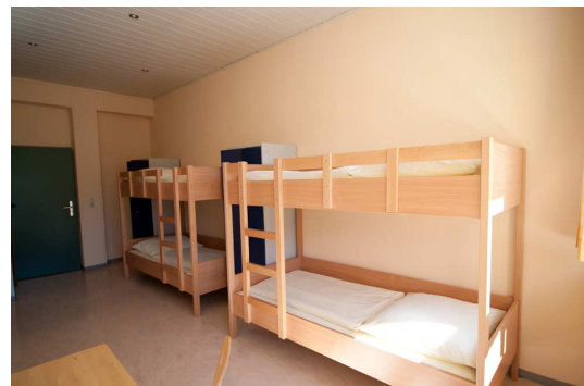
4-Bett Zimmer mit Dusche/ WC