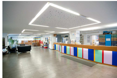
Rezeption & Lobby