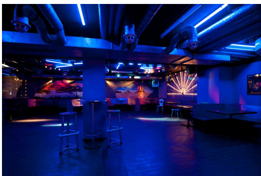
Bar/ Disco "Discovery"